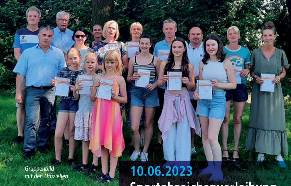
Gruppenbild mit den Offiziellen