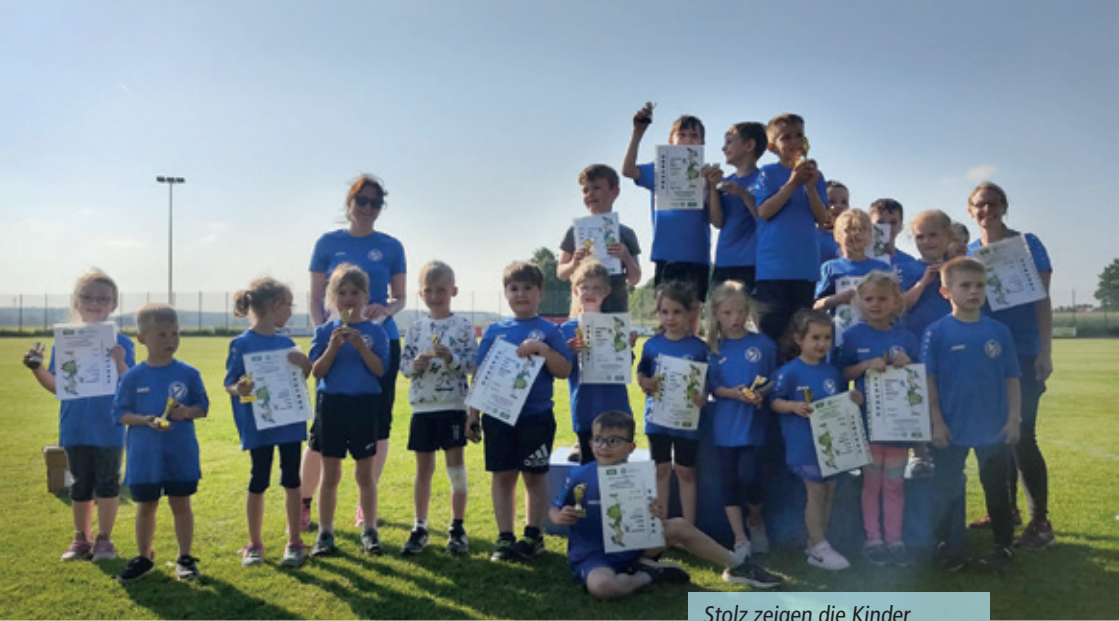
Stolz zeigen die Kinder ihre Jolinchen-Sportabzeichen