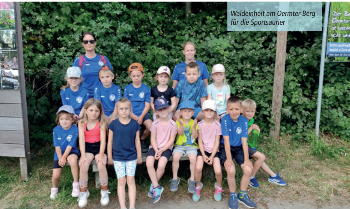
Waldeinheit am Oermter Berg für die Sportsaurier

In dieser Gruppe steht das Entdecken und der Spaß ohne Leistungsdruck im Vordergrund, somit ist kein strikter Ablauf vorgesehen. Krabbeln, klettern, hüpfen, balancieren oder bewegliche Landschaften bringen sehr viel Abwechslung in die Sportstunde. So ist es kein Wunder, dass die Kinder sehr viel Spaß an Bewegung haben und sich jede Woche aufs Neue freuen.