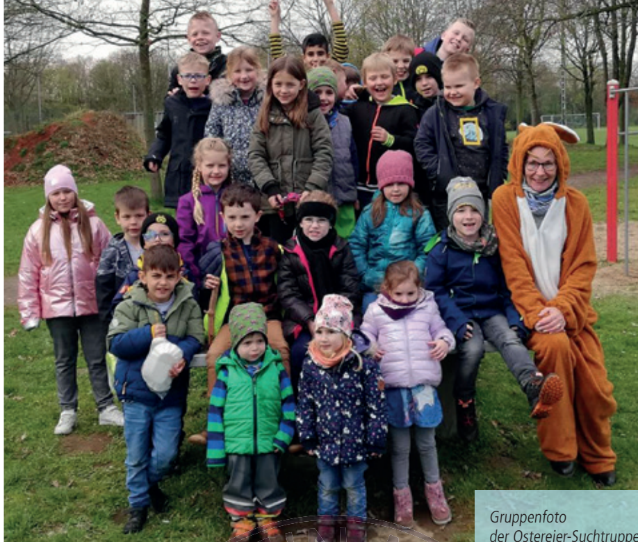
Gruppenfoto der Ostereier-Suchtruppe