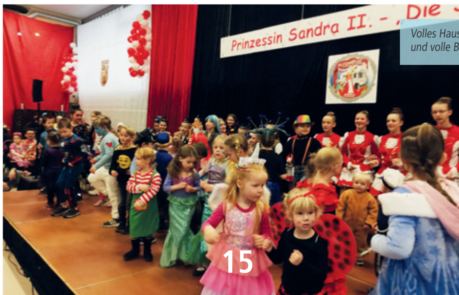
Volles Haus und volle Bühne