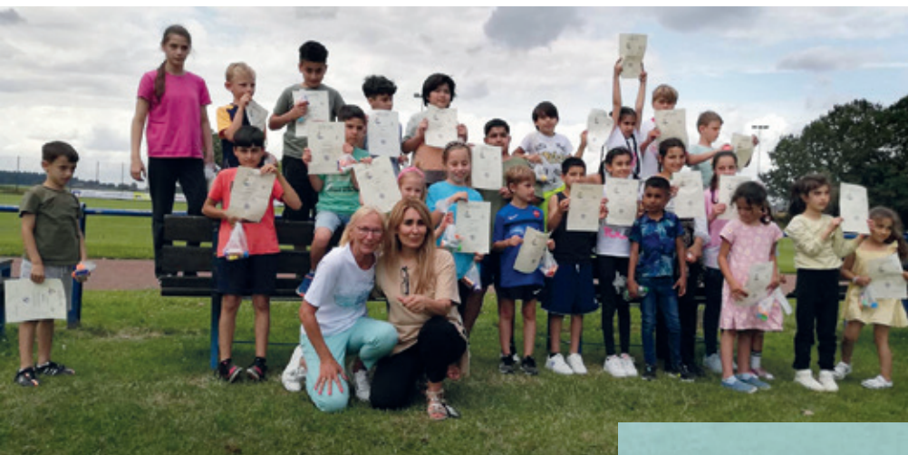
Abschlussbild mit (fast) allen Teilnehmern